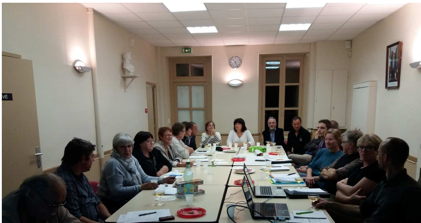
Photo prise lors de la dernière assemblée générale à Villiers-le-Mahieu le 29/09/2017

Autres communes adhérentes: Mareil-le-Guyon, Saint-Léger-en-Yvelines, Les Mesnuls, Emancé, Villiers-le-Mahieu, Thiverval-Grignon, Saint-Rémy l'Honoré, Grosrouvre, Galluis, Flexanville, Vicq, Autouillet, Le Tremblay-Sur-Mauldre, La Queue Lez Yvelines